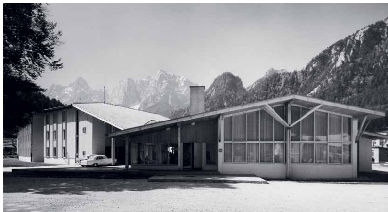
Hotel Prisank, Kranjska Gora, 1961–63, arh. Janez Lajovic