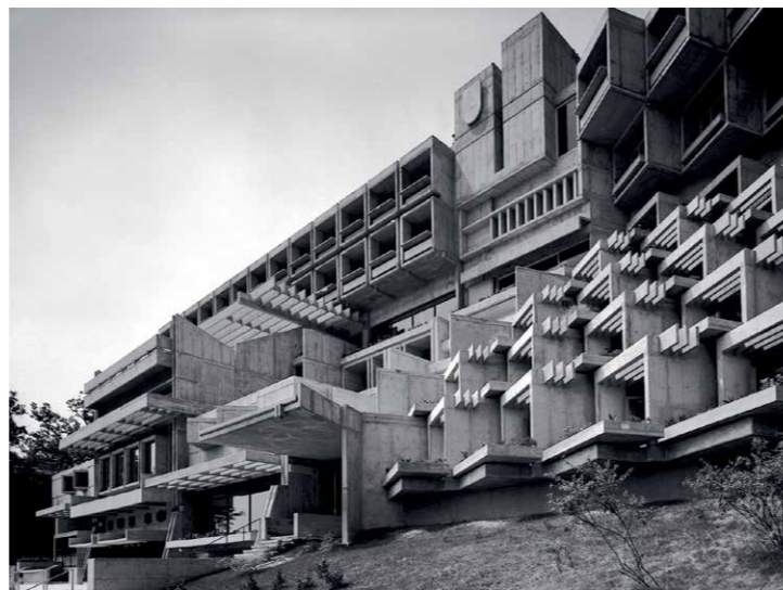
Hotel Adriatic II, Opatija, 1971, arh. Branko Žnidarac