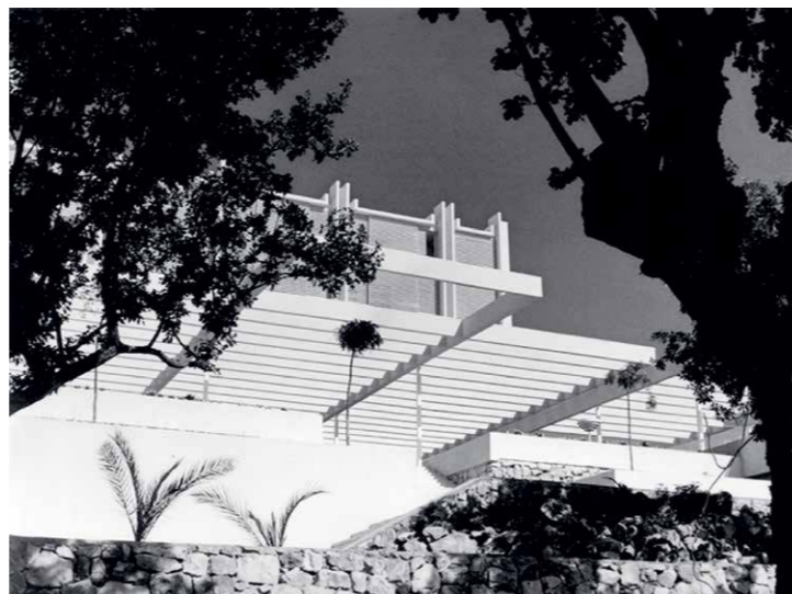
Hotel Haludovo, Malinska, otok Krk, 1969–72, arh. Boris Magaš, foto arhiv Aleksandar Karolyi