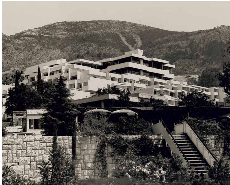
Hotel Plat, Miina, 1969–71, arh. Petar Kušan