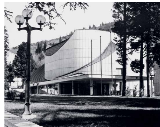
Avditorij in letno gledališče Portorož, 1970–72, arh. Edo Mihevc