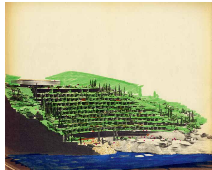
Hotel Libertas, Dubrovnik, 1968–74, arh. Andrija Činin-Šain, Žarko Vincek, foto arhiv Činin-Šain/HMA HAZU