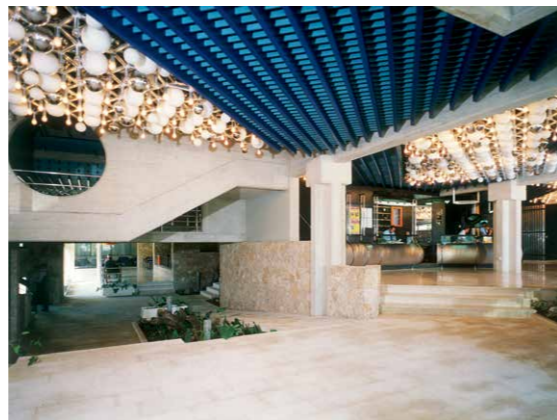
Hotel Soline, Brela, 1973–83, arh. Julije De Luca