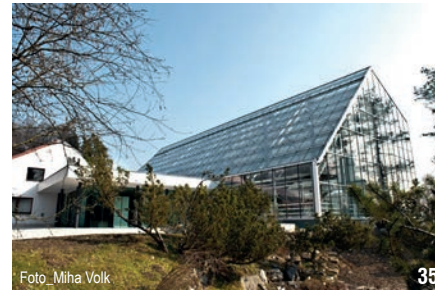
35