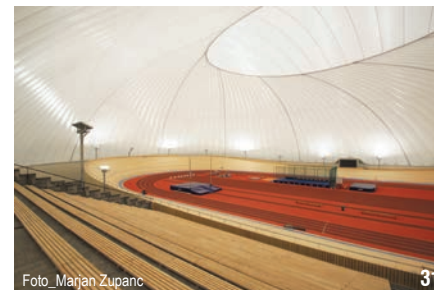
31