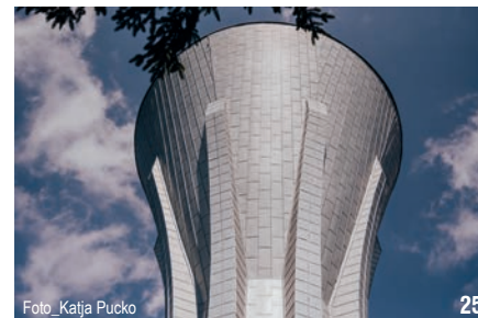
Foto_Katja Pucko 25

23 SPOMINSKI RAZGLEDNI STOLP, GONJAČE, GORIŠKA BRDA, 1961 Marko Šlajmer