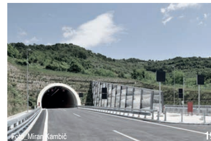
19