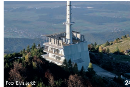
Foto_Elvis Jerkič 24