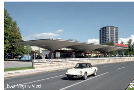
Foto_Virginia Vrecl 33

31 VELODROM IN ATLETSKA DVORANA, ČEŠČA VAS PRI NOVEM MESTU, 1996, 2019 Stane Udovč; Duo; Ralph Schurmann; Marjan Zupanc, Air projektiranje; Marko Coloni