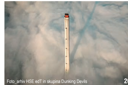
edT in skupina Dunking Devils 20